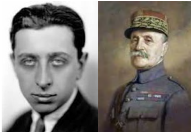
Robert Desnos y Ferdinand Foch